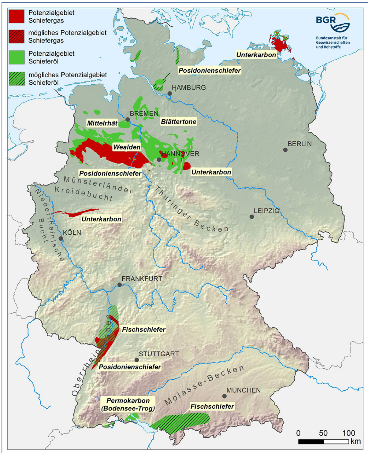
Abbildung 2: Übersicht der Potenzialgebiete in Deutschland